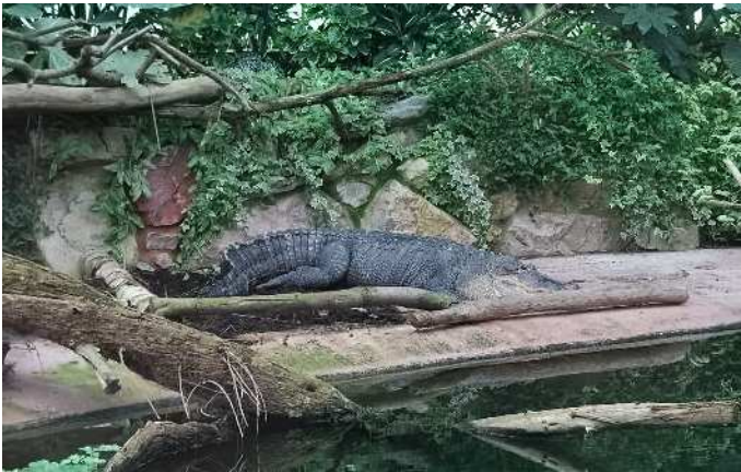
Alligator du Mississippi dans l'Espace Tropical