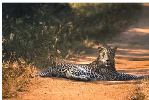
Depuis 2008, CERZA soutient le projet d'étude des panthères au Sri Lanka

Grâce à la création en 2000 de l'association CERZA CONSERVATION, le parc zoologique CERZA s'implique dans de nombreux programmes de sauvegarde dans la nature. L'association a pour but de financer des projets de protection de la faune et de la flore, de soutenir financièrement et de faciliter l'éducation des communautés locales sur la nécessité de protéger les espèces animales et végétales. CERZA finance