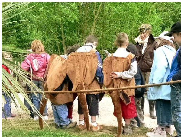
Les enfants déguisés en kangourous découvrent le rôle de la poche marsupiale