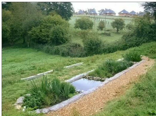
Grâce à la station d'épuration biologique, les plantes et les bactéries traitent naturellement les eaux usées du parc

Les éoliennes construites en novembre 2010 servent à la production d'électricité issue de l'énergie du vent. Les panneaux solaires thermiques placés sur l'Espace Tropical permettent de chauffer l'eau des bassins des alligators du Mississippi. Des panneaux solaires thermiques sont également placés sur le toit des lodges (notre service d'hébergement) afin de produire suffisamment d'eau chaude pour une famille de 6 personnes. Une plaque photovoltaïque est installée sur la maison des tapirs terrestres produisant la lumière nécessaire aux besoins journaliers des soigneurs animaliers. Des plaques photovoltaïques sont également placées sur la Serre aux perroquets.