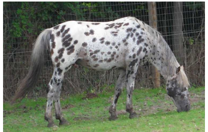
Appaloosa © JPM