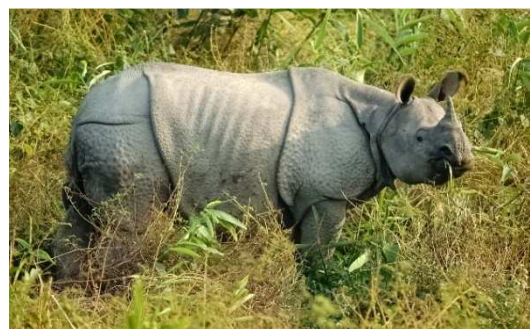
En 2010, CERZA signe un partenariat de 24 000 euros sur 3 ans pour la protection des rhinocéros indiens dans le parc national de Manas