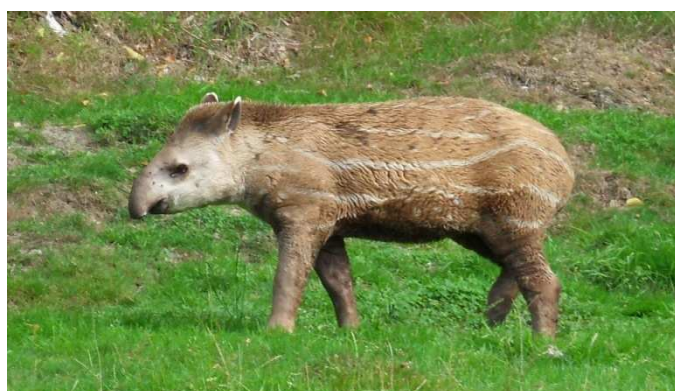
Jeune tapir terrestre