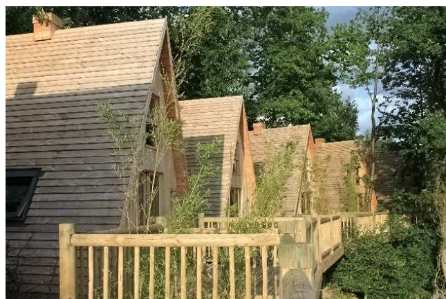
"Zoobservatoire", nouvel hébergement avec vue sur les siamangs et la Vallée Asiatique

En 2006, CERZA créé un concept d'hébergement unique en Europe : le CERZA Safari Lodge. 26 bungalows en bois, directement inspirés des réserves de parcs nationaux, sont construits en bordure du parc zoologique offrant ainsi une vue imprenable sur la "Vallée Asiatique" où s'ébattent les rhinocéros indiens, cerfs, antilopes et singes siamangs. En 2010, le CERZA Safari Lodge diversifie son service d'hébergement en implantant les "Zoobservatoires" : bungalows en bois pouvant accueillir jusqu'à 4 personnes. Sur le site du CERZA Safari Lodge des wallabies de Bennett et des muntjacs (petits cervidés asiatiques) vivent en totale liberté et évoluent autour des habitations.