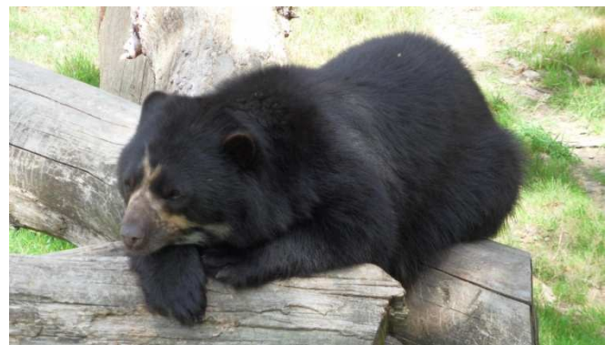
Ours à lunette