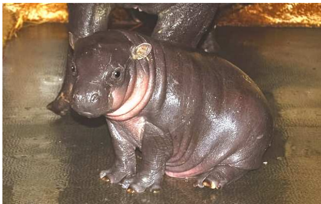
Hippopotame nain : âgée d'un mois et demi, Mendé a déjà pris 10 kilos depuis sa naissance