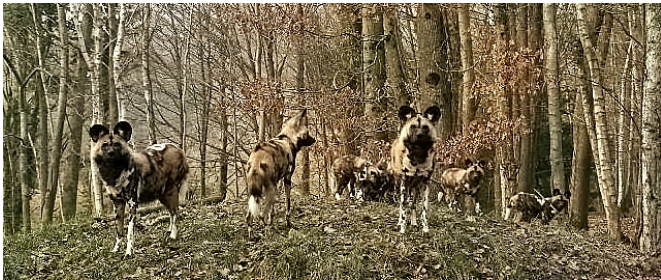
Lycaons : 6 nouvelles frimousses à découvrir

Deux circuits pédestres indépendants et un circuit en safari train sont proposés aux visiteurs. Quel que soit le circuit adopté, l'immersion dans la nature et la vie des animaux sauvages est totale, le dépaysement absolu