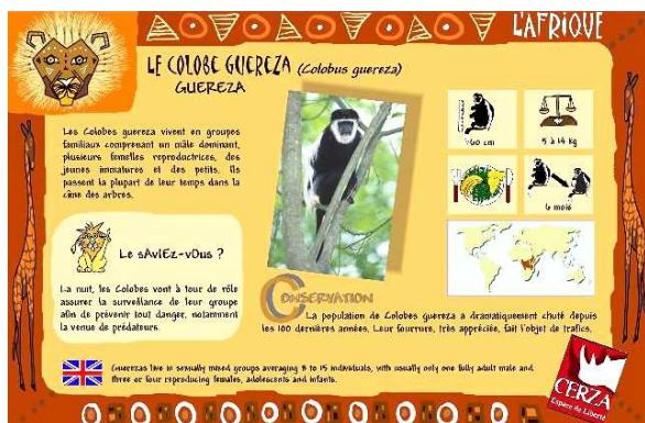
Panneau pédagogique du parc

Un des objectifs des parcs zoologiques est l'éducation à l'environnement et au respect de la vie sauvage. Chaque année, plus de 300 000 visiteurs dont 40 000 scolaires arpentent les allées du parc. La pédagogie est alors au centre de l'attention que nous portons aux visiteurs. Passive ou active, l'éducation est variée.