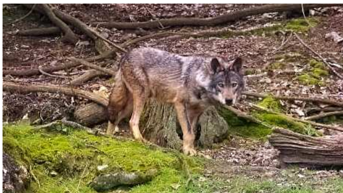
Loup ibérique