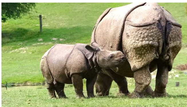
Manas, jeune rhinocéros indien né en février 2010