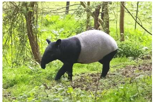
Tapirs malais arrivés au CERZA en 2008

D'une durée de 20-25 minutes, laissez-vous guider par les commentaires et les explications du chauffeur de train. Vous découvrirez alors les rhinocéros indiens, les babouins hamadryas, les geladas, les lycaons, les tigres de Sumatra, les buffles nains du Congo et la Plaine Africaine. Le Safari Train est accessible aux personnes à mobilité réduite.