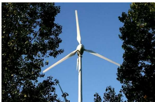
Les éoliennes s'intègrent parfaitement dans le paysage normand

Depuis 2005, le parc zoologique CERZA met en place ses "initiatives écologiques" afin de favoriser les énergies renouvelables, réduire nos déchets, préserver l'eau et la biodiversité. Cette démarche écologique s'inscrit dans une volonté toujours plus forte de limiter notre impact sur l'environnement. Si la France s'est engagée à satisfaire 23% de sa consommation d'énergie à partir d'énergie renouvelable d'ici 2020, CERZA va atteindre la production de 32% de nos besoins énergétique à la fin 2011. Ce grâce aux panneaux solaires thermiques, plaques photovoltaïques et éoliennes installés dans le parc.