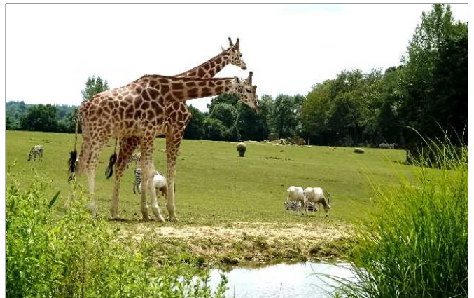
Mixité avec les girafes, rhinos blancs, zèbres, antilopes et autruches dans la Plaine Africaine

Vallonné, le parcours jaune fait voyager les visiteurs à la découverte des animaux du continent Nord-Américain (bisons d'Amérique, Appaloosas, loups d'Alaska), Sud-Américain (loup à crinière, ours à lunettes, tamarins, tapirs terrestres, capybaras), Européen (loups ibériques, ours bruns), Asiatique (tapirs malais, rhinocéros indiens, cervidés, tigres blancs, gibbons à mains blanches) et Australien (kangourous roux, wallabies, cacatoès, oies semi-palmées).